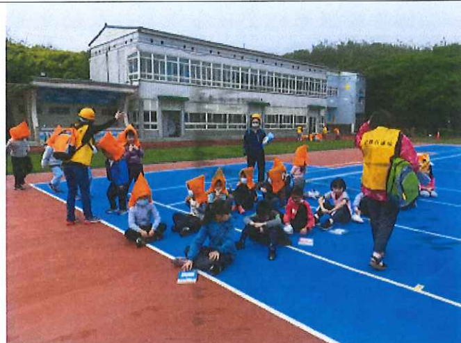
地點：操場 時間：110年3月19日 說明：疏散集合後進行清點班級人數