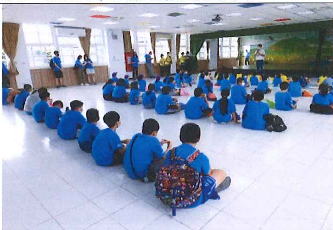
地點：新北市五華國小 時間：110年10月14日 說明：五華國小進行疏散演練說明