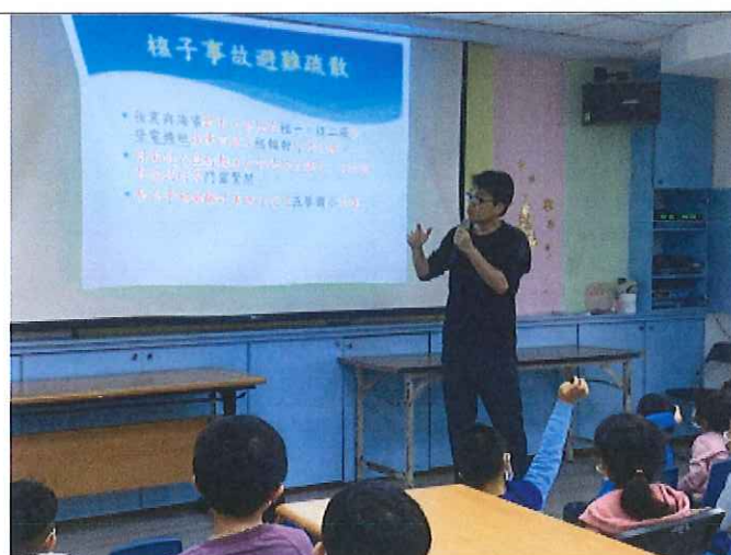
地點：視聽教室 時間：110年3月19日 說明：說明核子事故避難疏散應變重要事項