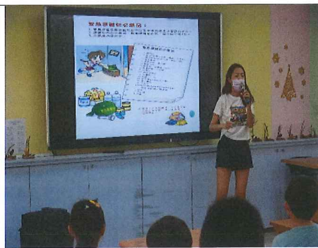
地點：視聽教室 時間：110年9月11日 說明：說明緊急避難包該準備哪些必需品