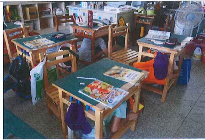
地點：班級教室 時間：110年9月11日 說明：學生進行就地掩蔽動作