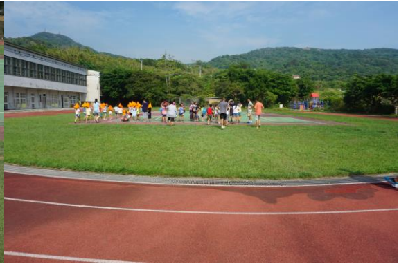
集結、清點人數(心理安撫)