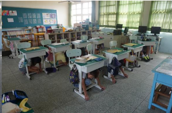
就地掩蔽—掩蔽3步驟