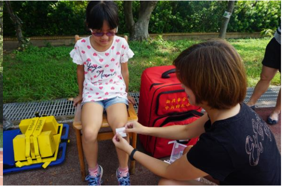
成立救護站、傷患處置