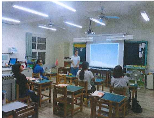
二年級親師座談會