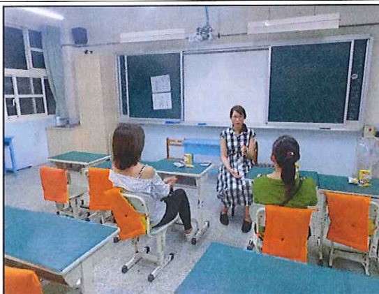
六年級親師座談會