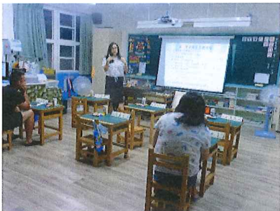
一年級親師座談會