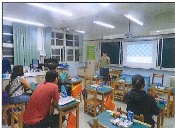
三年級親師座談會