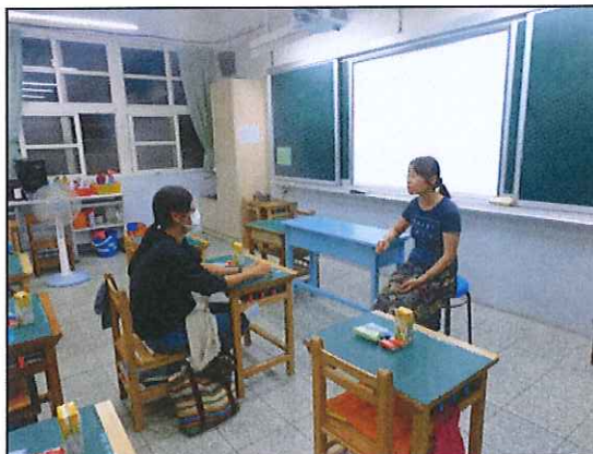
四年級親師座談會