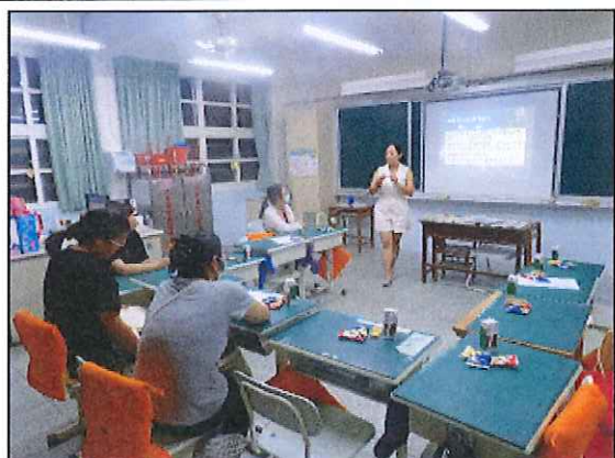
五年級親師座談會