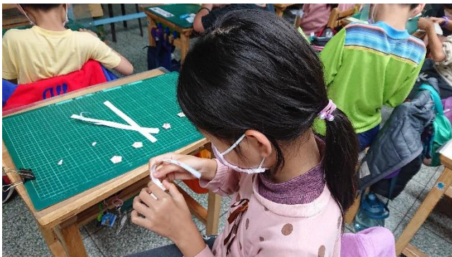
第一次摺星星，有點挑戰！但學生皆很認真、很仔細的完成它。