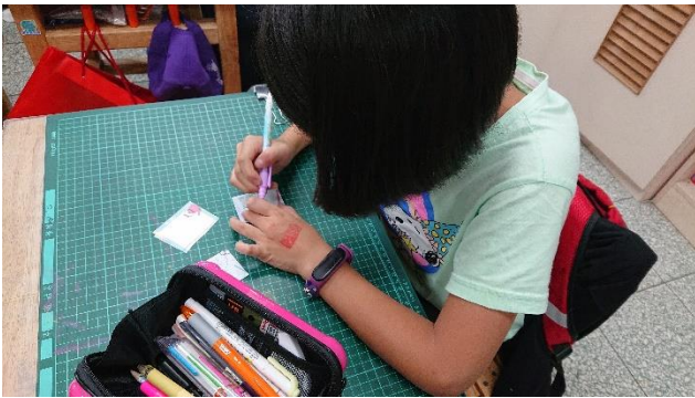
先寫出愛的小卡片