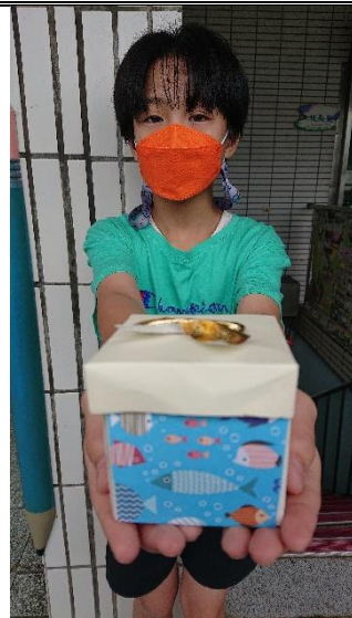
將滿滿心意獻給家人