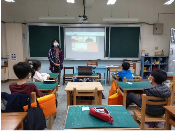
教師闡釋定義家庭暴力