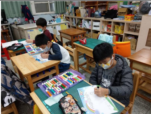
學生進行紫絲帶著色