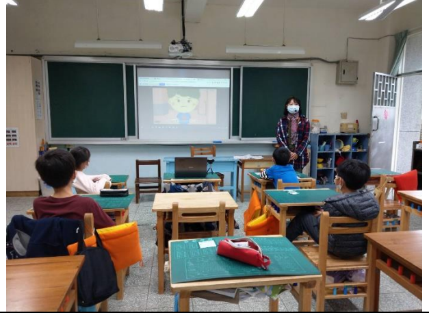
教師闡釋定義家庭暴力