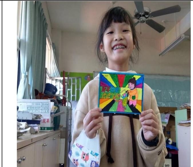
同學發表分享自己的關懷祝福卡