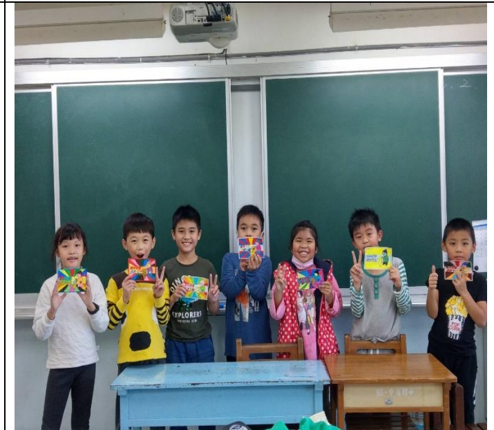
同學發表分享自己的關懷祝福卡