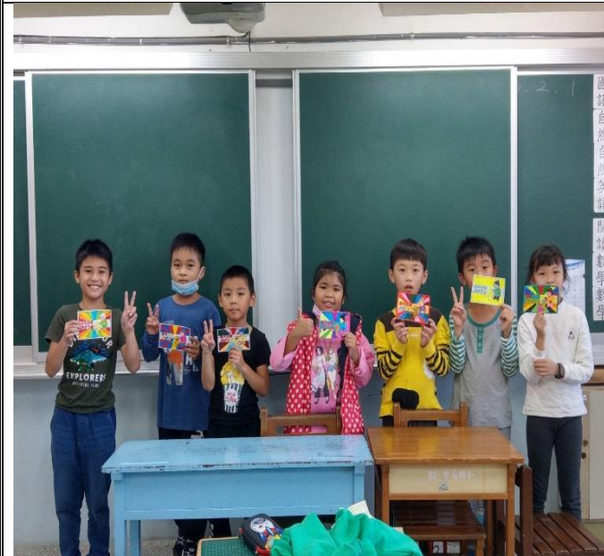
同學發表分享自己的關懷祝福卡