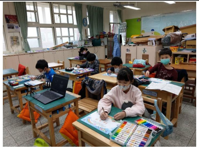
學生進行紫絲帶著色