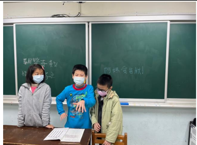
學生討論後上台進行發表文章內容