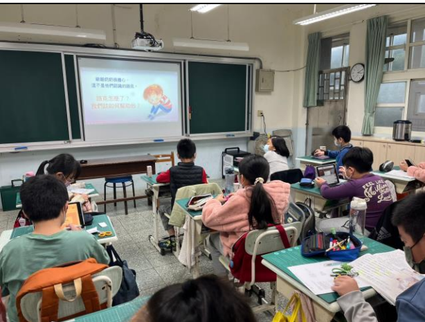
播放家庭暴力影帶，讓全班一同觀看