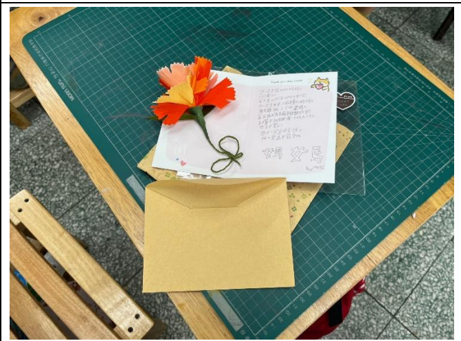
學生用心製作的康乃馨與卡片-2