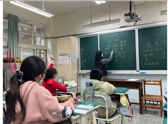
學生聽到家庭會聯想到什麼？