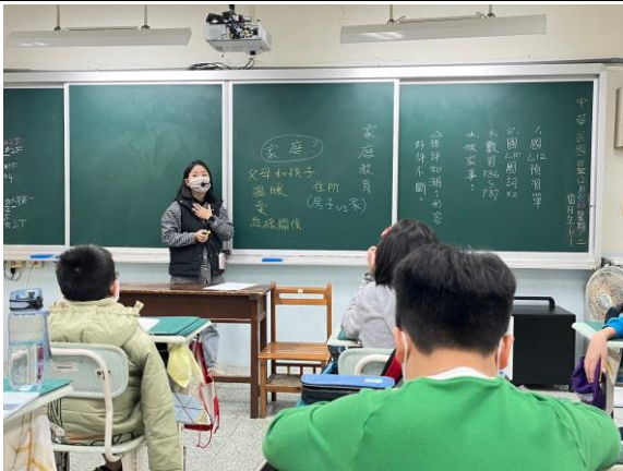
詢問學生家庭的意義是什麼？

說明：藉由對家庭的認識，進一步了解家庭的意義與重要性；並提高對於家庭暴力的認知，讓自己能尋求最合適的方法，幫助自己與他人。