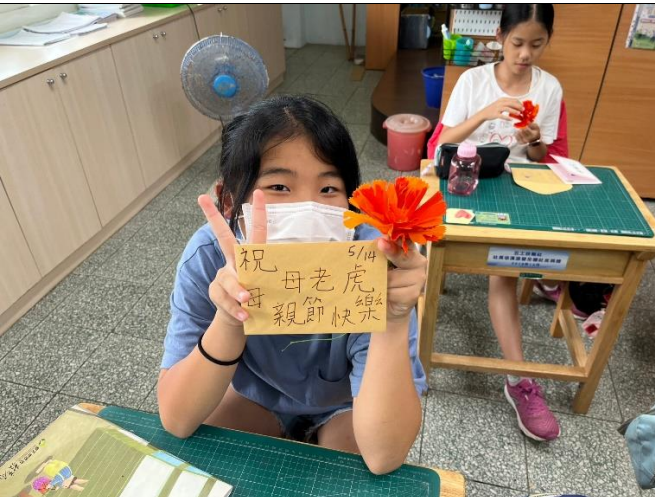
學生用心製作的康乃馨與卡片-1