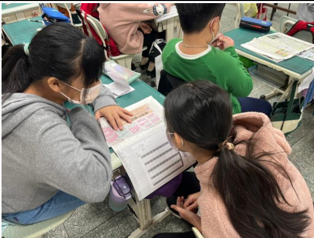
學生進行分組，找出感受最深的文章