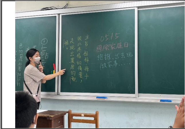
教師說明國際家庭日