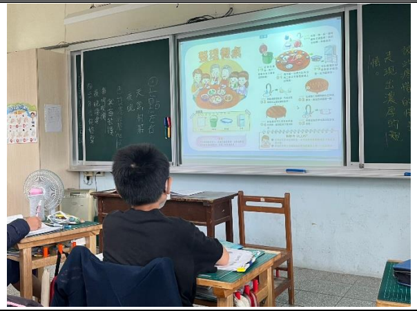
介紹家庭好妙方手冊