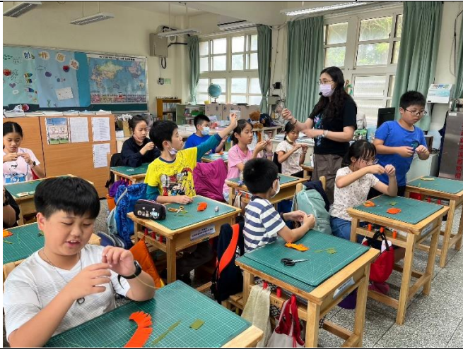
康乃馨教學與製作