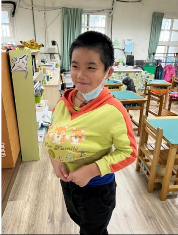
學生肚子放皮球感受懷孕的沉重-1