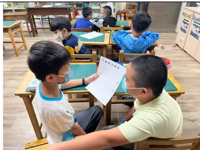
學生互相討論對方家人職業的特質應該有什麼