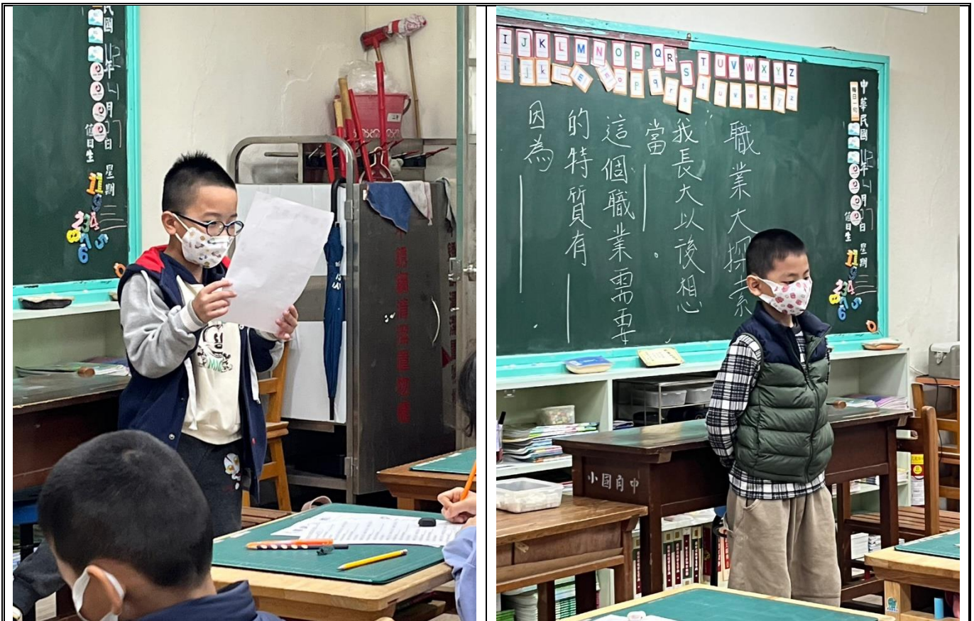
學生進行口頭發表，介紹自己長大想當的職業並介紹其特質