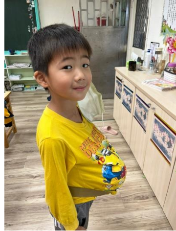
學生肚子放皮球感受懷孕的沉重-2