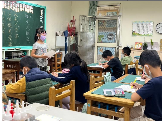
學生互評對方的口頭發表內容