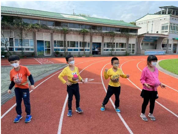
學生懷孕跳健康操的樣子