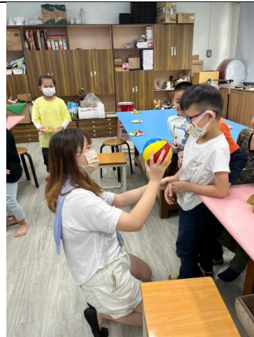
老師幫忙學生拿下皮球