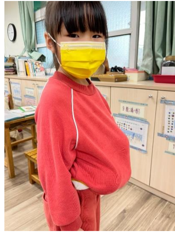
學生肚子放皮球感受懷孕的沉重-2