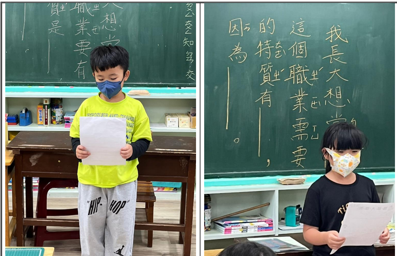
學生進行口頭發表，介紹自己長大想當的職業並介紹其特質