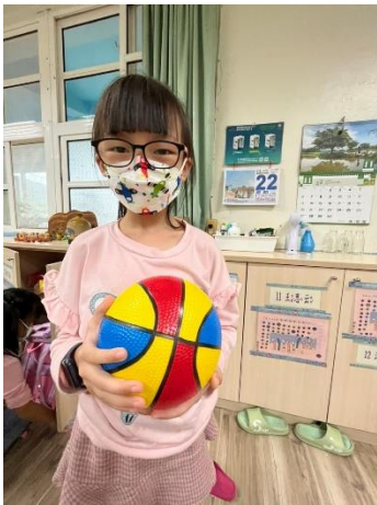
拿下皮球後如釋重負的樣子