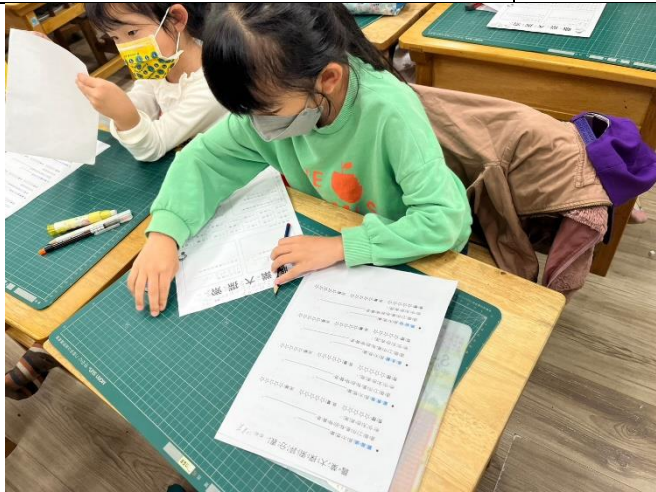
學生互評對方的口頭發表內容