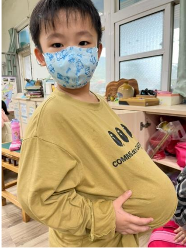
學生肚子放皮球感受懷孕的沉重-1