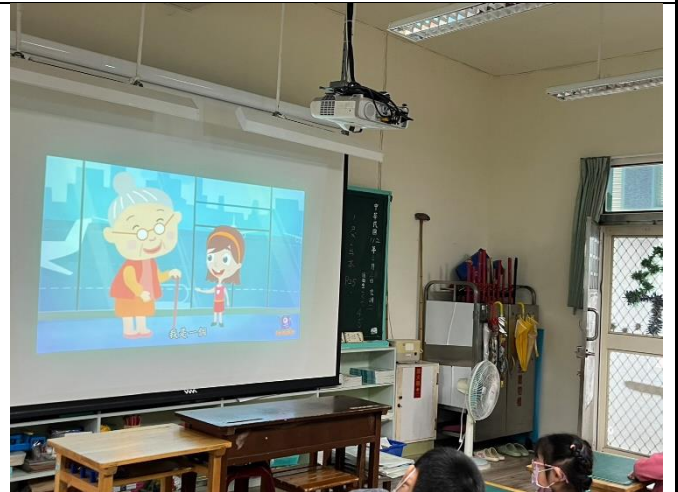
學生認識藉由影片探究職業