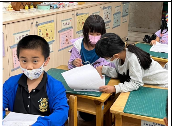
學生互相討論對方家人職業的特質應該有什麼