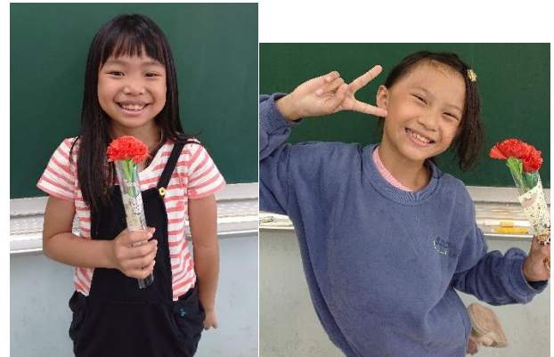
完成並寫上卡片感謝家人的照顧。