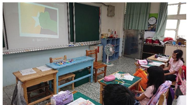
紫絲帶活動推薦的影片觀賞： 達達的超能力