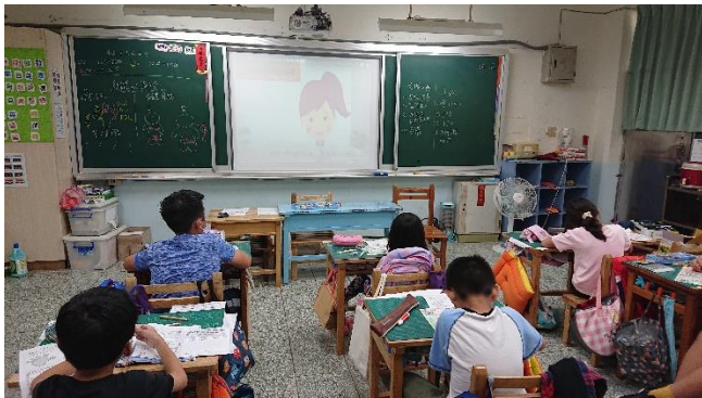
紫絲帶活動推薦的影片觀賞： 達達的超能力