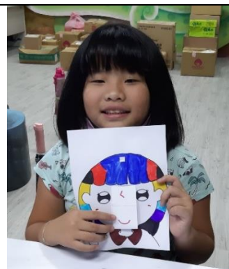
說明：自製臉譜做好了！哈！可以張嘴做表情唷！