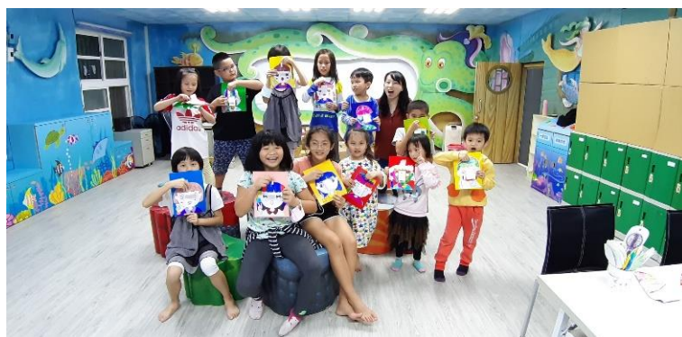
說明：學生們從活動中，了解情緒、思維方向可能會影響解決事情的態度及結果。活動結束前，與自製臉譜合影，也希望學生能常保心情愉快，以正向思考來解決問題。