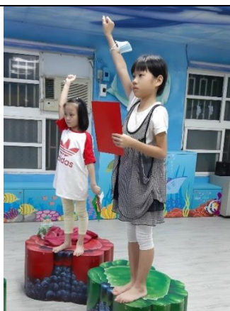
說明：學生拿著臉譜進行其他活動。