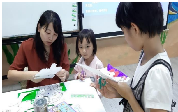
說明：講師協助年紀較小的學生製作趣味臉譜。