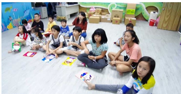
說明：最後進行影片觀賞。